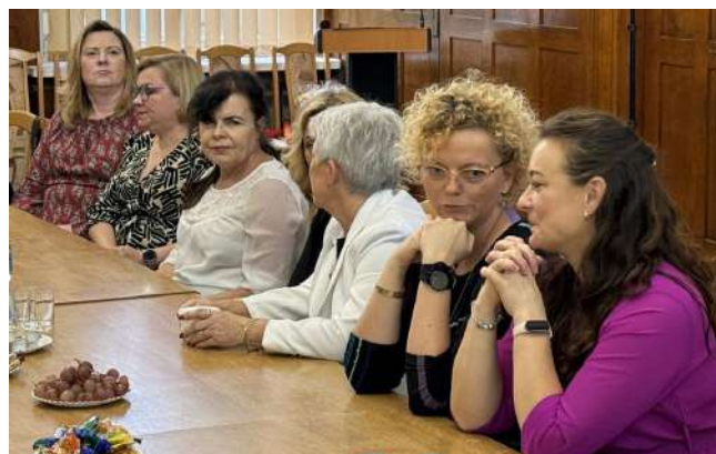
W październikowym spotkaniu z okazji Dnia Edukacji Narodowej uczestniczyli nauczyciele oraz dyrektorzy miejskich szkół i przedszkoli