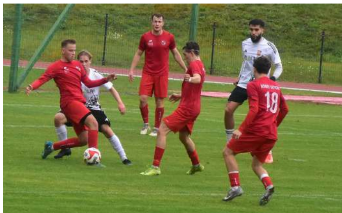
Piłkarze Mamr Giżycko (czerwone stroje) są rewelacją rundy jesiennej