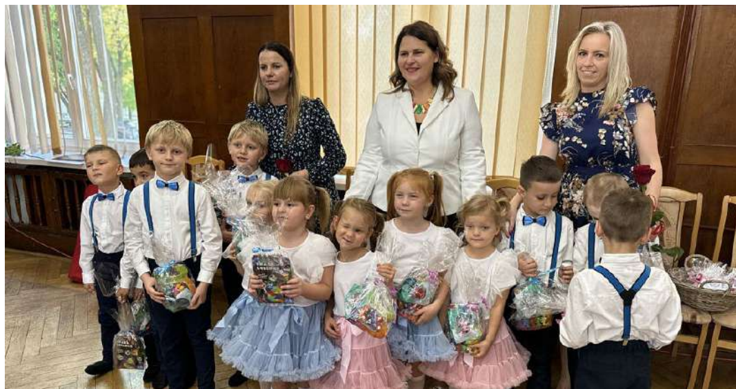
Uroczystość w Urzędzie Miejskim uświetnił występ artystyczny giżyckich przedszkolaków

Z okazji Dnia Edukacji Narodowej w sali konferencyjnej Urzędu Miejskiego i w sali Państwowej Szkoły Muzycznej w Giżycku uhonorowano wyróżniających się pedagogów z przedszkoli oraz szkół podstawowych i średnich. Poznacie Państwo nazwiska laureatów tegorocznych "nauczycielskich Oscarów", czyli Nagrody Kuratora, Nagrody Starosty i Nagrody Burmistrza oraz nauczycieli odznaczonych prestiżowymi medalami.