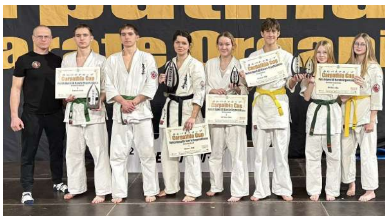
Z dalekiego Rzeszowa Giżycczanie wrócili z pięcioma medalami