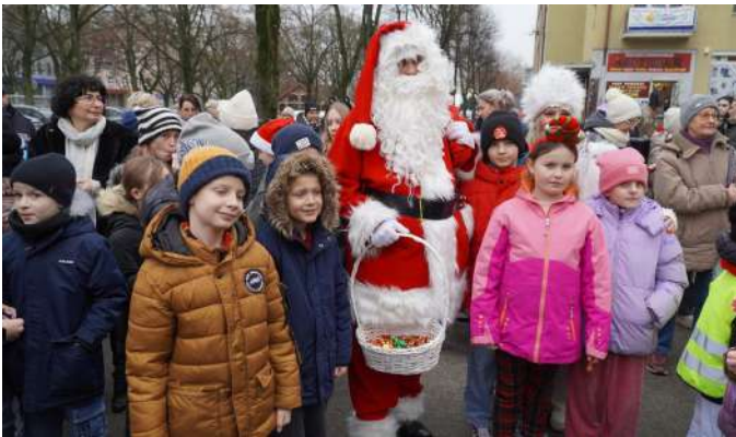
Fot. Katarzyna Zadroga-Prusik