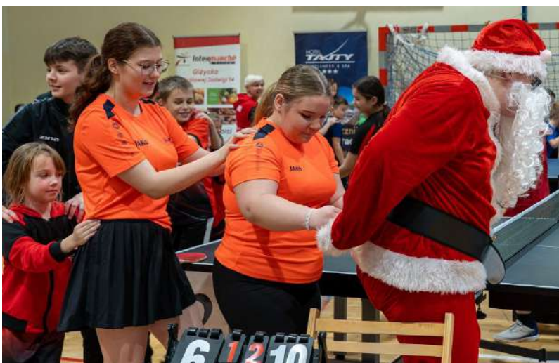
Trzeba otwarcie powiedzieć, że Święty Mikołaj jak mało kto "umie w zabawę"