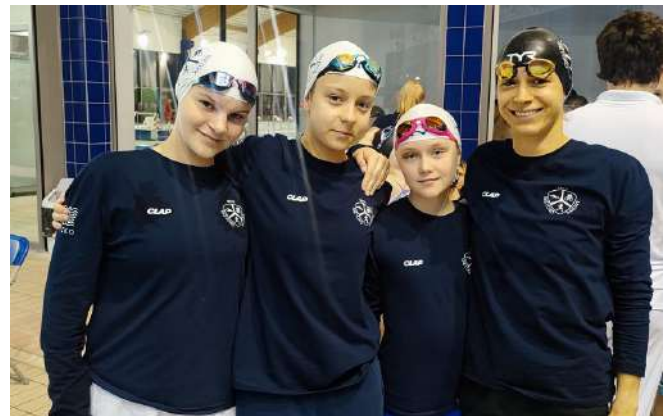
Pływacy giżyckiego "Medyka" na podium w Elblągu stawali 11 razy