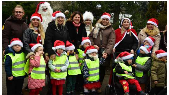
Fot. Katarzyna Zadroga-Prusik