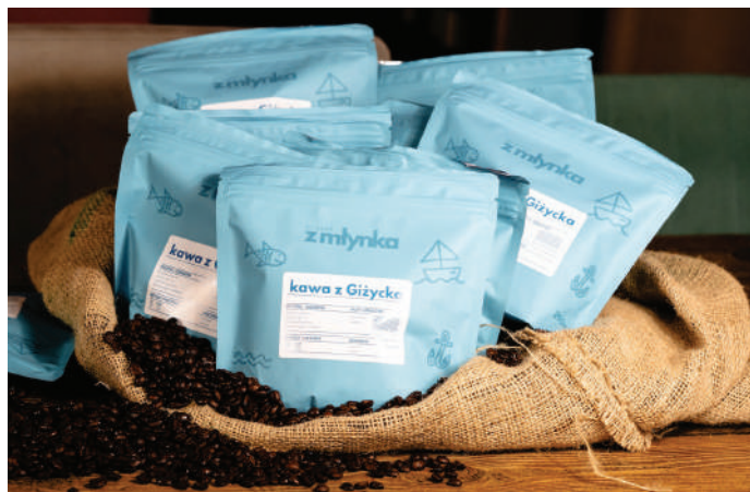
Rybka, żaglówka, kotwica, Giżycko - mazurski charakter widać gołym okiem

Justyna Maciejewska-Kucfir (UM w Giżycku)